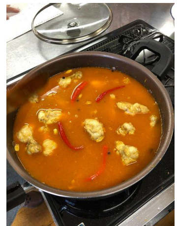
チリペッパーを入れる