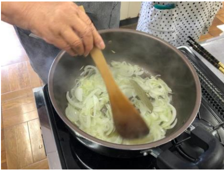
玉ネギを透明になるまで炒める