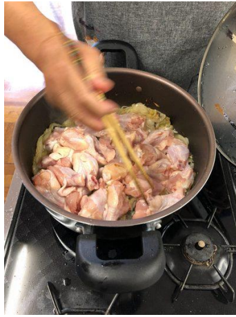
鶏肉を入れフタをする