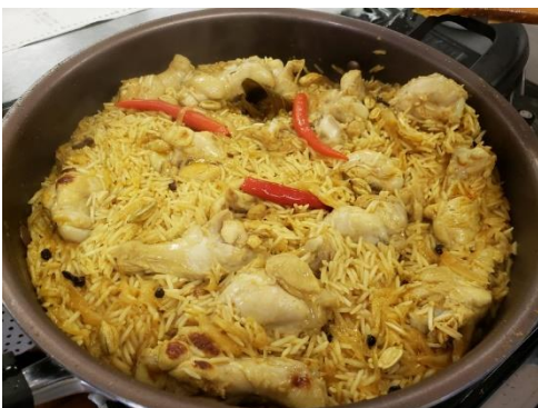
火を止めてフタをして15分蒸らす

厚手の鍋を使うと良い！ フライパンでも出来ると思う。 玉ネギを良く炒めるのがコツ！ 鶏肉はモモ肉を使ってもOK。 チリペッパーは唐辛子より辛いので 好みに調整して入れてね。