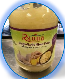
ジンジャー・ガーリック