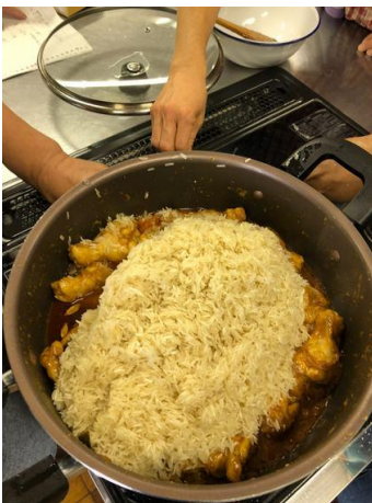
お米を入れて良く混ぜる