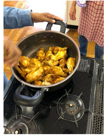
裏返してとろとろにする