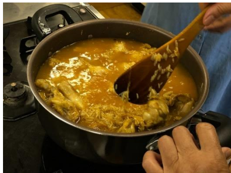
お水を入れてフタをする